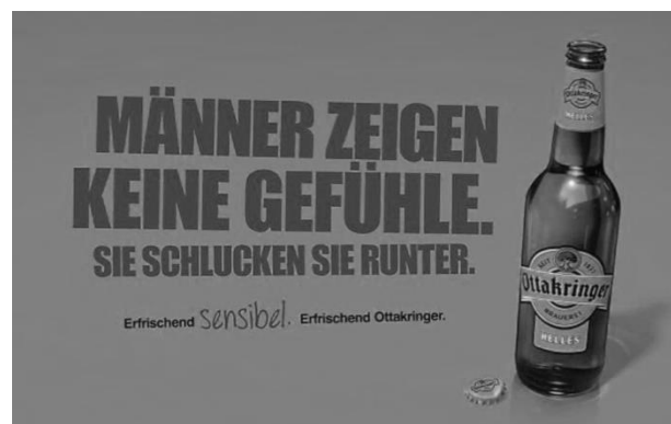
Рис. 6 Реклама пива марки «Ottakringer» (Відень, 2012)

Реклама пива від Ottakringer (напр.Рис.6): Männer zeigen keine Gefühle. Sie schlucken sie runter. Erfrischend sensibel. Erfrischend Ottakringer (укр. «Чоловіки не показують своїх почуттів. Вони їх ковтають. Освіжи чутливість з Ottakringer».) Реклама виокремлює стереотипні погляди на чоловіка у суспільстві: пиво, жінки та сон. Такі припущення допускають рекламні агенції, бо їх хвилює лише розпродаж товарів, а не думки які несуться у широкі маси. Такі лозунги можуть призвести до маскулінного дуалізму: чоловік або Бог, або істота.