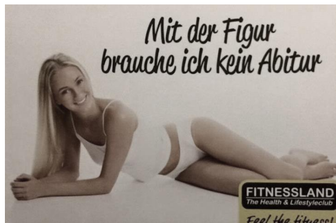
Рис. 3 Візитна картка «Fitnessland.The Health&Lifestyleclub» (Любек, 2016)

Візитна картка Fitnessland.The Health&Lifestyleclub - Mit der Figur brauche ich kein Abitur (укр. З фігурою, але без диплома). Статевий потяг як ворожий сексизм, який констатує цінність жінки. Жінка через маскуліну призму панування думки виглядає спростованою та нездатною ні на що. Розумних жінок не існує. Реклама фітнес-клубу (Любек, 2016) наголошує, що жінка, очевидно, змушена використовувати всі засоби, щоб «здобути» кращу роботу; врешті-решт отримувати не згідно професійної компетенції. напр.Рис.3: