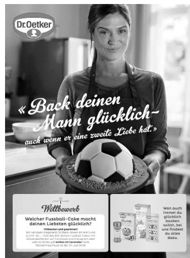
Рис. 1 Реклама віпички від компанії Dr.Oetker (Швейцарія, 2018)

«Порадуй свого чоловіка випічкою» (напр.Рис.1) — стереотипний рекламний слоган або доброзичливий сексизм, який не втрачає своєї актуальності протягом останніх 20 років. Для більшості світу чоловік, безумовно, повинен залишатися головним інвестором у сім'ї, але жінок обмежують в їх активній позиції. Рекламні агенства, ймовірно, підозрюють, що жінками легше маніпулювати та пропагувати їх місію на Земній кулі через їх обмежене коло інтересів. Жінка повинна сидіти вдома, а між покупками та пранням у неї точно є достатньо часу для своєї сім'ї: