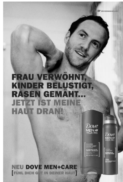
Рис. 5 Постер «DoveMen+Care» (Гамбург, 2010)

Реклама пива від Ottakringer (напр.Рис.6): Männer zeigen keine Gefühle. Sie schlucken sie runter. Erfrischend sensibel. Erfrischend Ottakringer (укр. «Чоловіки не показують своїх почуттів. Вони їх ковтають. Освіжи чутливість з Ottakringer».) Реклама виокремлює стереотипні погляди на чоловіка у суспільстві: пиво, жінки та сон. Такі припущення допускають рекламні агенції, бо їх хвилює лише розпродаж товарів, а не думки які несуться у широкі маси. Такі лозунги можуть призвести до маскулінного дуалізму: чоловік або Бог, або істота.