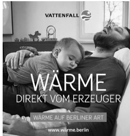
Рис. 4 Кампанія Vattenfall із кумедними картинками Берліна (Берлін, 2018)

Vattenfall є європейською енергетичною компанією яка виробляє екологічно чисту енергію: Wärme direkt vom Erzeuger (укр. Тепло від виробника) За для власної рекламної піар-компанії вони теж вдалися до реклами, де стереотипно транслюється чоловіча іпостась (напр.Рис.4), не думаючи, що висміюють половину Земної кулі. Компанія демонструє батька, який не може сидіти з власною дитиною замість цього просто спить, бо втомився від активної малечі. Важко чоловікам бути у ролі батька.